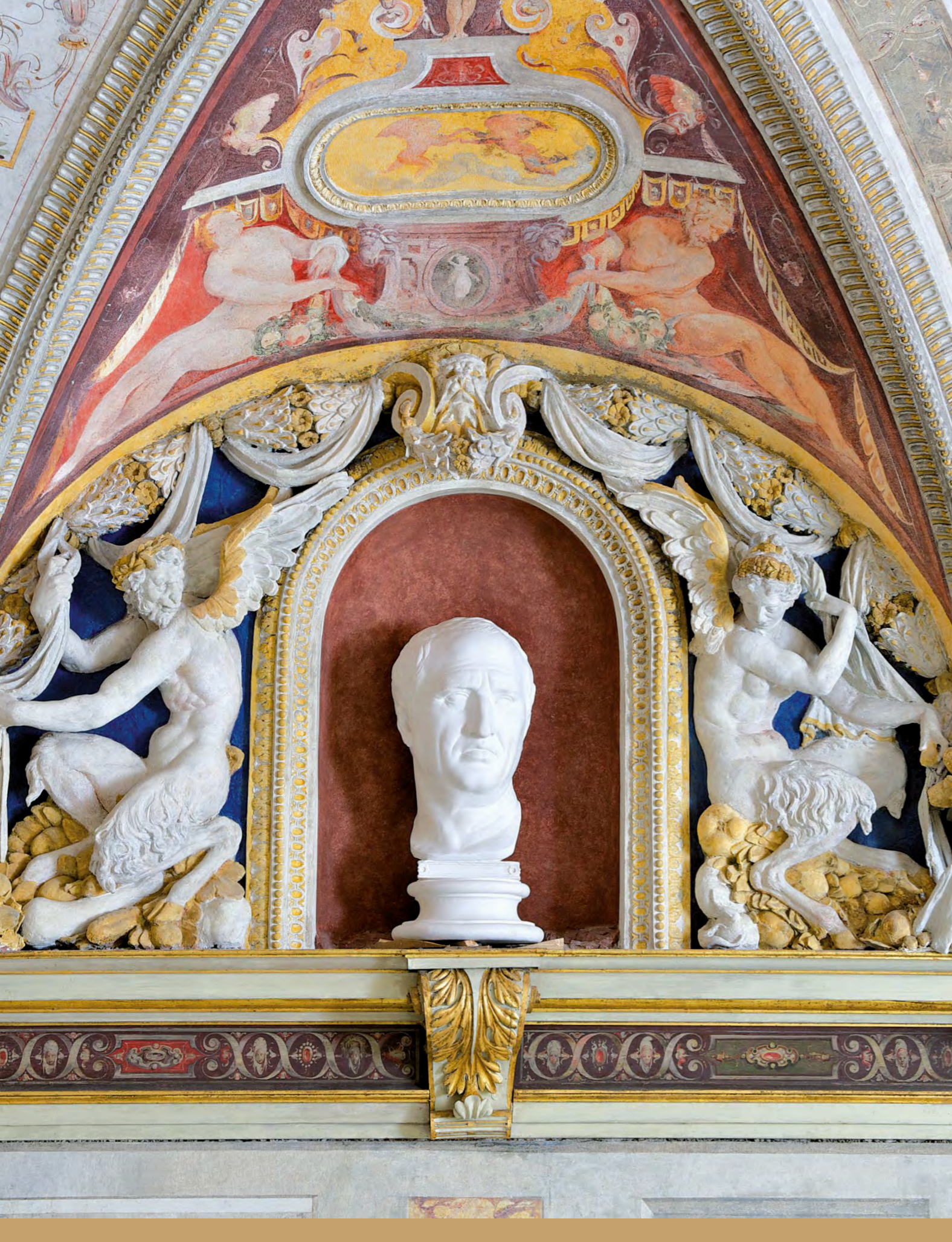
Die Badstuben, zwei prächtige Sammlungskabinette aus der zweiten Ausstattungsperiode der Fuggerhäuser, in denen unter anderem die Kunstsammlung Hans Fuggers (1531–1598) untergebracht war, sind ein einzigartiges Zeugnis des internationalen Manierismus in Deutschland.